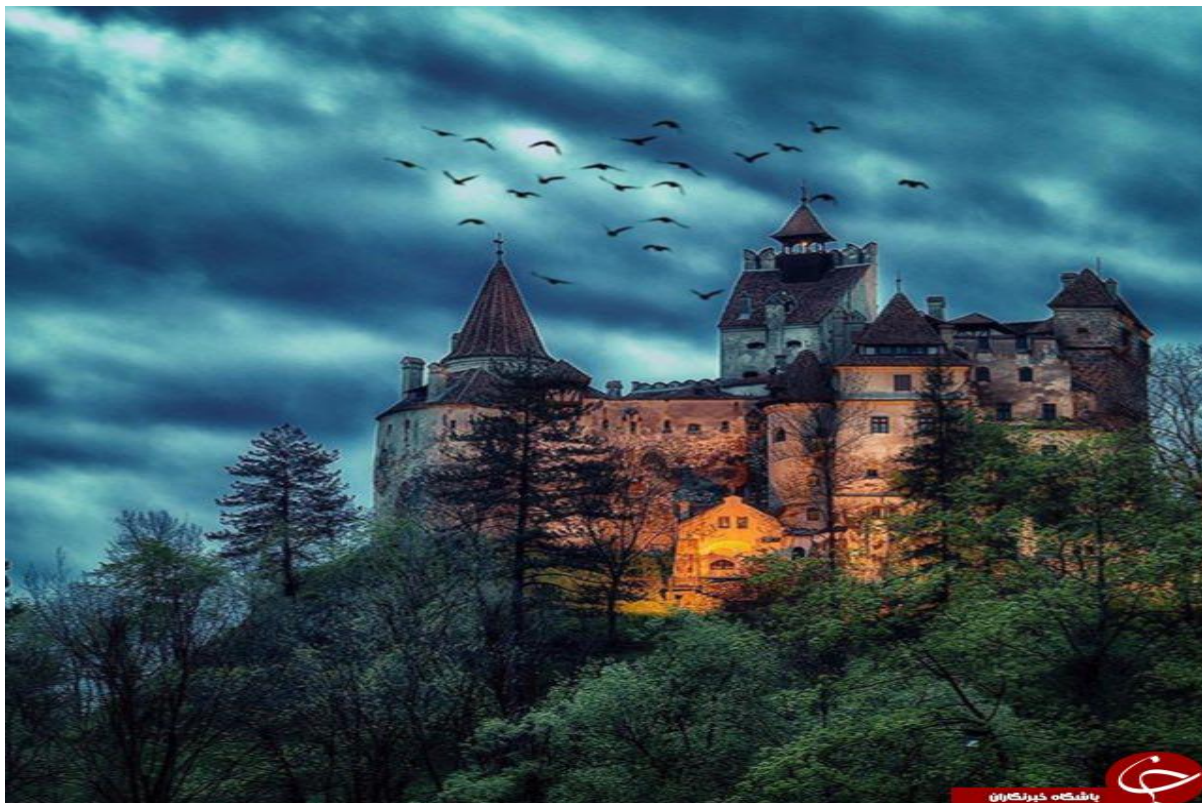
قلعه دراكولا ، روما ني