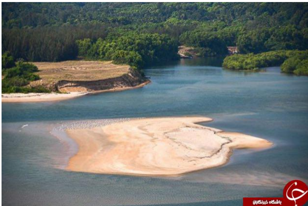
ساحل گوا ، هند