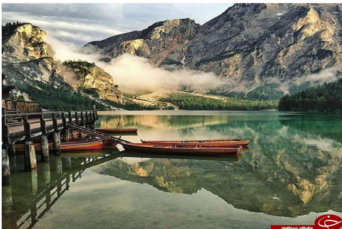
لاگو دي برايس ، ایتالیا